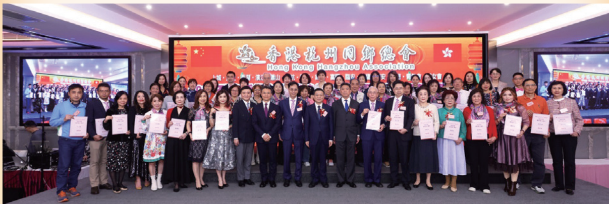
2025 香港杭州同鄉總會 1+15 表彰 2024 年度優秀義工