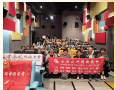
2025 專場播放中國動畫《哪吒之魔童鬧海》