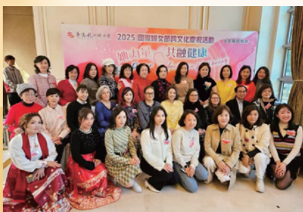
杭州婦女會主辦2025年國際婦女節跨文化慶祝活動「她力量·共融健康」主題引領全球女性共創未來