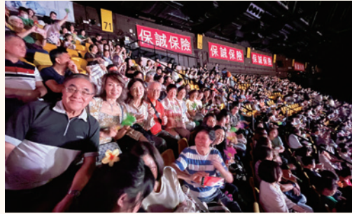
2025杭會義工欣賞「星耀紫荆慶回歸」紅館晚會