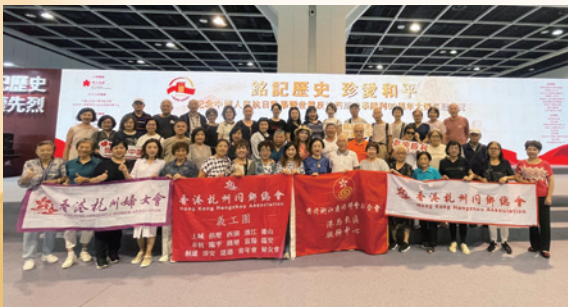
杭會參觀紀念中國人民抗日戰爭暨世界反法西斯戰爭勝利80周年大型巡迴展覽