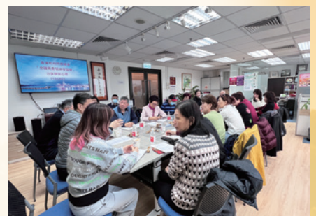
杭會和東區義工學習全國「兩會」精神心得分享