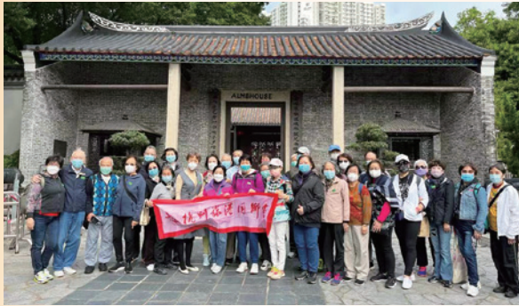
2022 香港古蹟歷史尋遊之旅