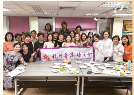
2024召開理事擴大會議暨慶祝母親節