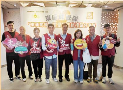
2024東滿關懷關愛隊啟動禮