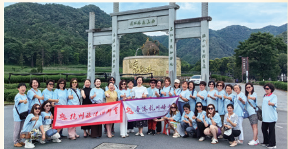
2024香港杭州婦女會拜訪杭州市婦聯