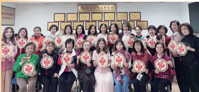
2025 杭婦會中國傳統藝術賀年剪紙工作坊