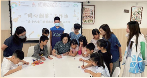
香港杭州婦女會公益活動