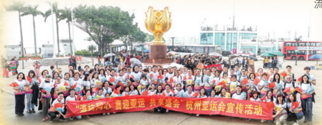
2023年4月2日，由杭州香港青年會舉辦的「港杭同心 喜迎亞運 共用盛會」杭州亞運會宣傳活動在香港舉行。