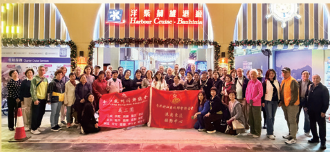
2025港島東服務中心洋紫荊海上夜遊