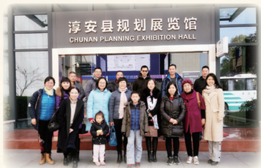
2018 同鄉會文化尋根之旅