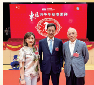
出席2026年東區民政事務處及東區各界 協會丙午新春團拜