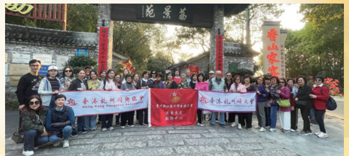
2025杭婦會 攜手邁向2026年 中山二天遊