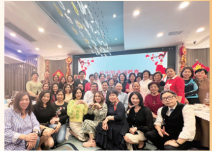
2024甲辰年杭州同鄉會理事會新春團拜