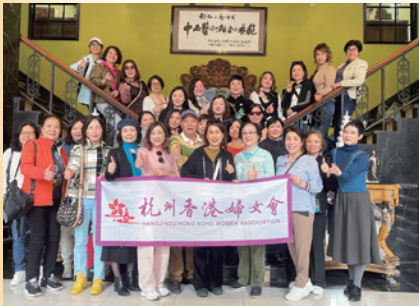
2024流光溢彩——探索古今藝術情醉三八婦女節