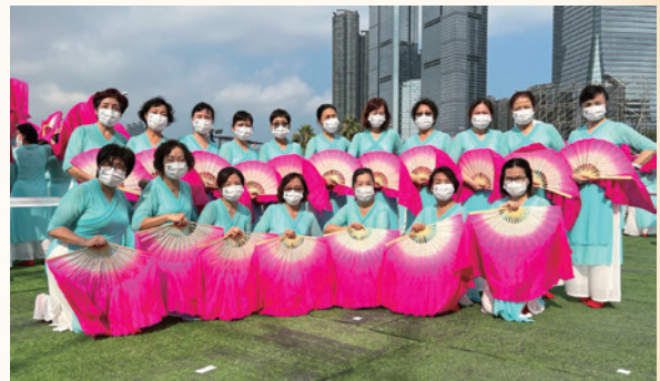
2022「紫荊綻放——千人魅力動感耀香江」破健力士世界紀錄活動