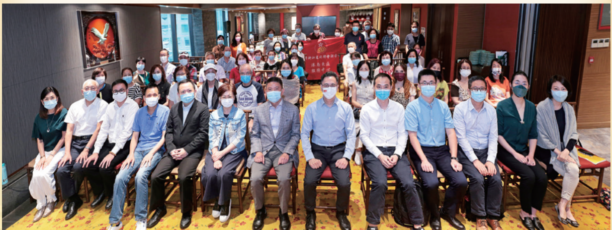
2021-07 香港島東服務中心義工骨幹培訓班