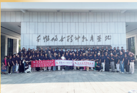
2025國情教育活動參觀千鶴婦女精神教育基地