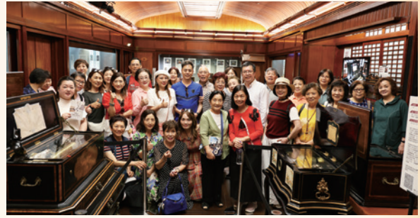
2024參觀樂韻留聲賀國慶