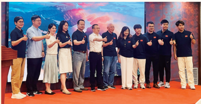
2025 杭會國情班學員義工經驗交流會