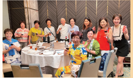
慶祝香港回歸祖國28周年暨東區義工聚會