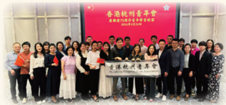
2024年9月24日，香港杭州青年會舉辦慶祝中華人民共和國成立75周年學習晚宴。近50名會員齊聚學習習主席予寧波籍企業家的回信。活動包括互動交流環節，令參加者加深對國家歷史與文化的了解。