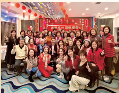
2025 乙巳金蛇年理事會新春團拜