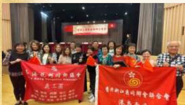
參加「2025年東區全國兩會精神分享會」