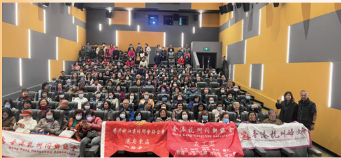
2025 專場播放香港電影「誤判」