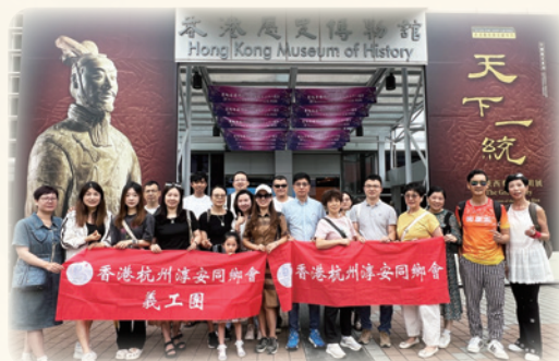
2025 慶祝香港回歸28周年“七一”活動