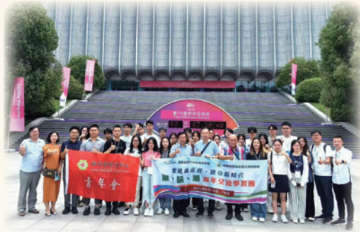
由香港新時代青年發展協會、培僑中學校友會和香港杭州臨安同鄉會青年會組成的滬杭港青年交流學習團回臨考察