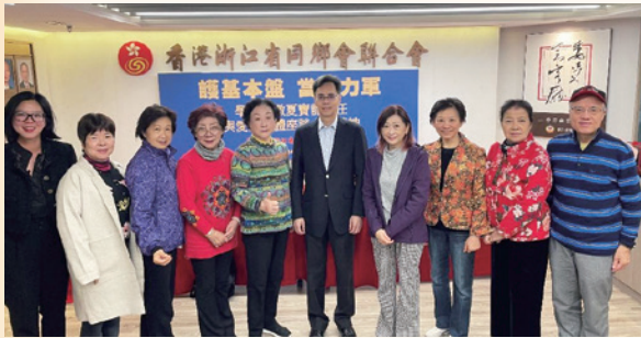
杭州義工骨幹出席浙聯會學習貫徹夏寶龍主任與愛國愛港團體座談會議精神