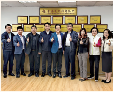
接待杭州電子科技大學代表團