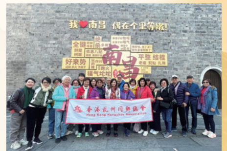
2025愛我綿繡河山江西行——走進贛鄞大地，共賞金秋畫卷