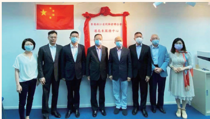
浙聯會港島東服務中心成立揭牌儀式