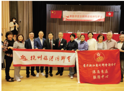
2024東區各界學習全國兩會精神分享會