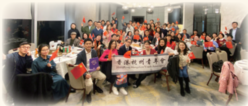
2025年2月20日，舉辦國家安全教育春茗聯歡活動，以輕鬆互動的形式推廣國家安全的重要性。