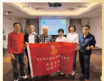
杭會義工出席東區地委會舉辦義工集結及感謝聚會