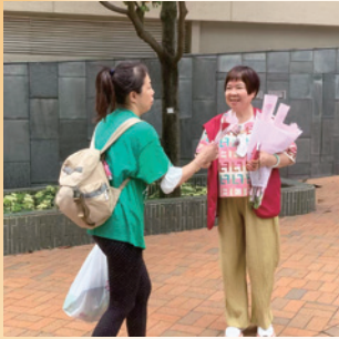
2025母親節東區社區派送鮮花