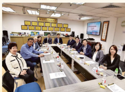
2025 與香港東區各界協會交流座談