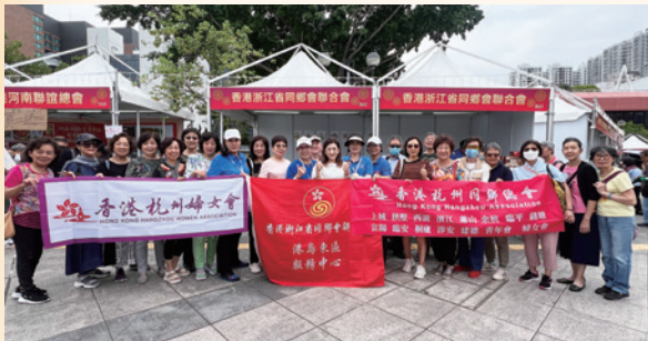
2024沙田公園「慶祝中華人民共和國成立75周年市集」