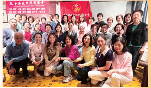
2025東區義工召集會議及國家安全教育培訓