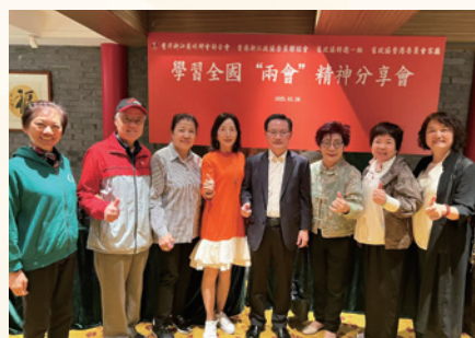
參加浙聯會兩會精神分享會