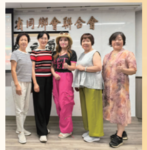
2025代表參加在浙聯會會所觀看閱兵直播活動