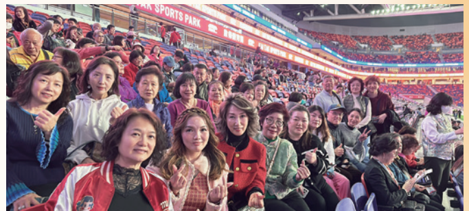
2025 杭會參加啟德體育園測試