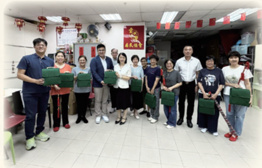
走訪慰問香港結對社區