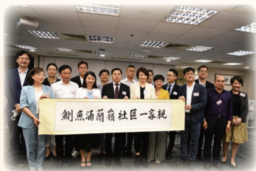
臨安區蘭嶺社區與香港劍魚涌社區結對儀式

我們香港杭州臨安同鄉會將一如既往，積極參與、支持特區政府的工作，更多聯誼鄉親，共建和諧社會。為致力維護在港臨安鄉親和各界友好合作努力，並共同努力把同鄉會建成一個溫暖的大家庭。