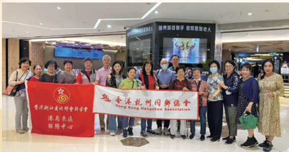
2024電影專場活動《志願軍》