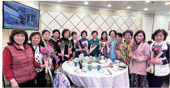
2024杭州同鄉會理事們相遇女神節