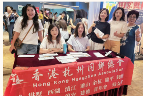
愛國電影專場《南京照相館》