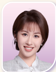
香港杭州青年會 杜文路