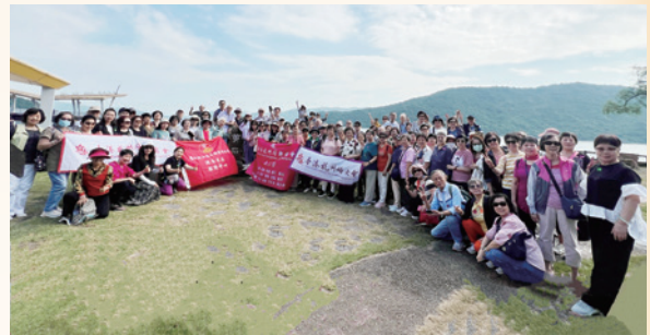
會員本地塔門一日遊