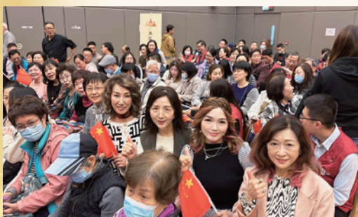
出席東區2025年全國兩會精神分享會