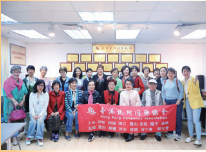
越劇愛好者與越劇名家舒錦霞相聚交流