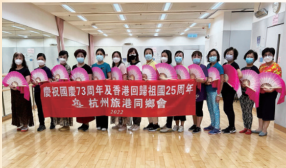
2022「紫荊綻放——千人魅力動感耀香江」