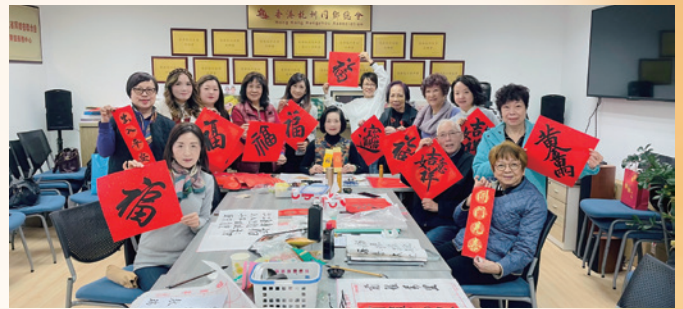
2025 書寫賀年揮春工作坊