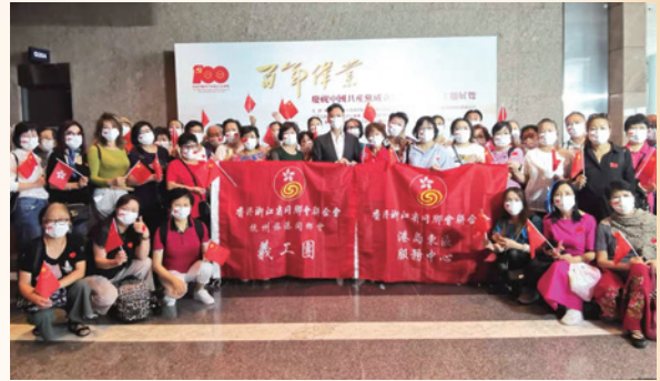
2022 參觀中國共產黨百年大業展覽