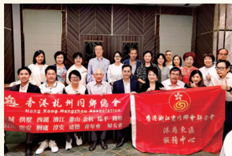
2025港島東服務中心杭總會 慶國慶聚會