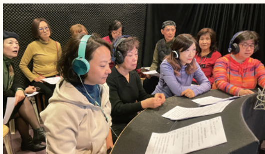
2025 聲演影視配音體驗挑戰賽